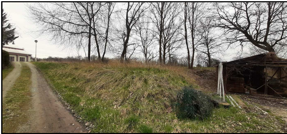
Pohled na bývalou skládku od severozápadu.