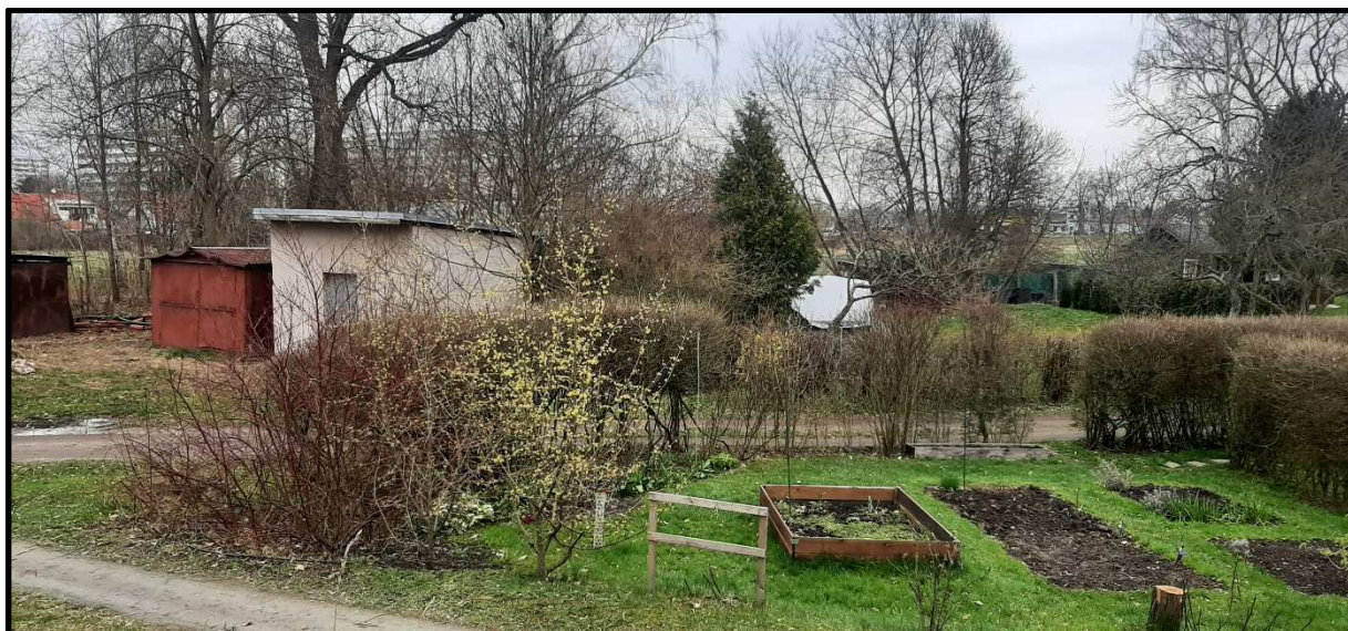
Pohled od jihu na objekt se studnou SP-1 z bývalé skládky.