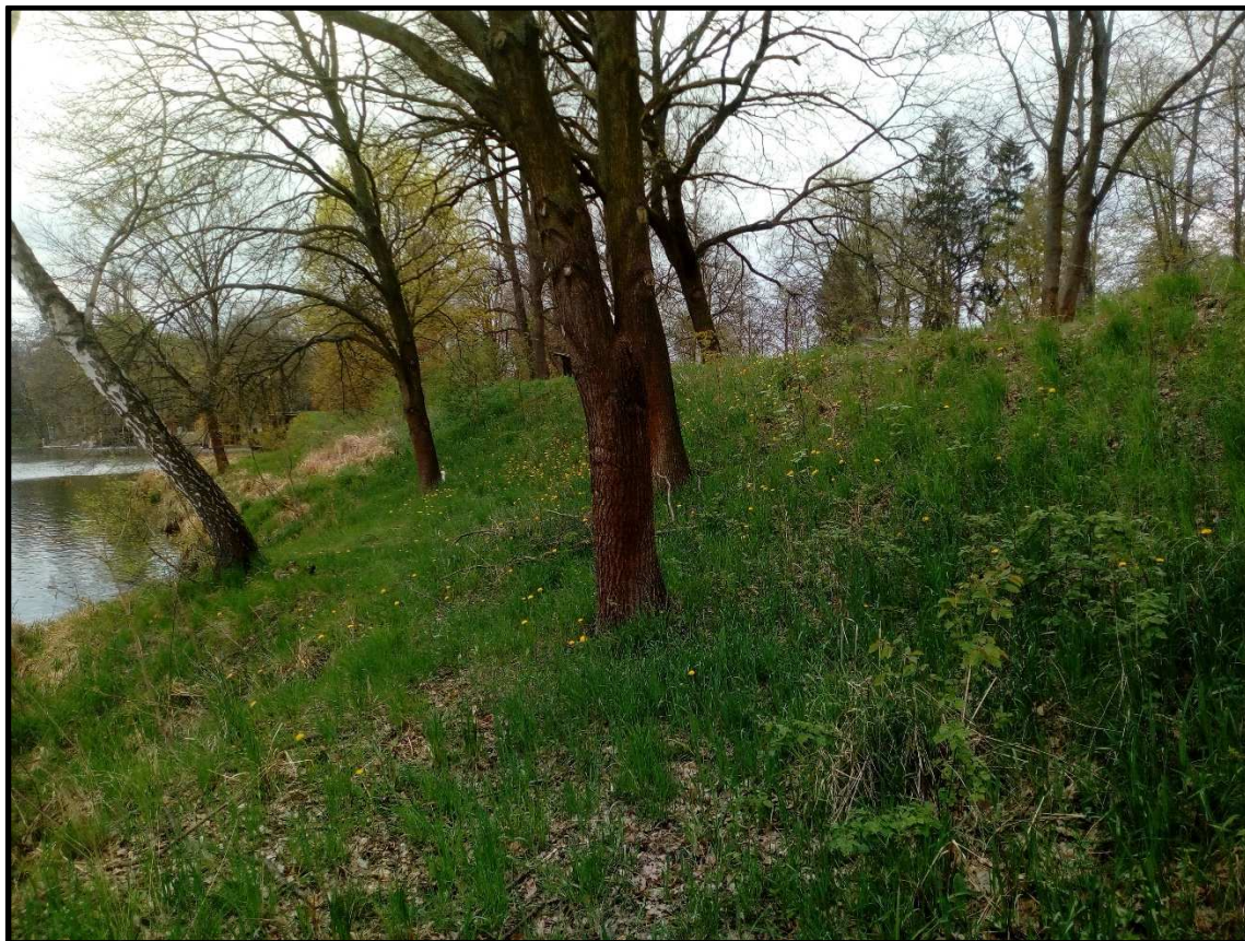
Hráz pod bývalou skládkou (foto po proudu toku).