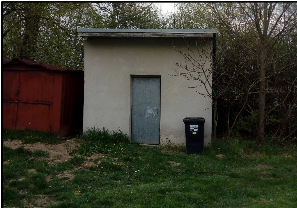
Zděný objekt, ve kterém je umístěna vrtaná studna SP-1.