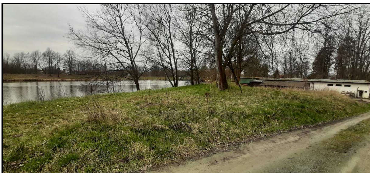
Pohled na bývalou skládku od východu.