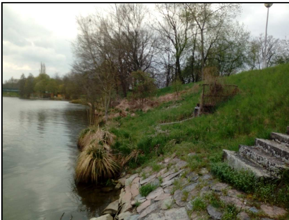
Tok Orlice u bývalé skládky (foto po proudu toku).