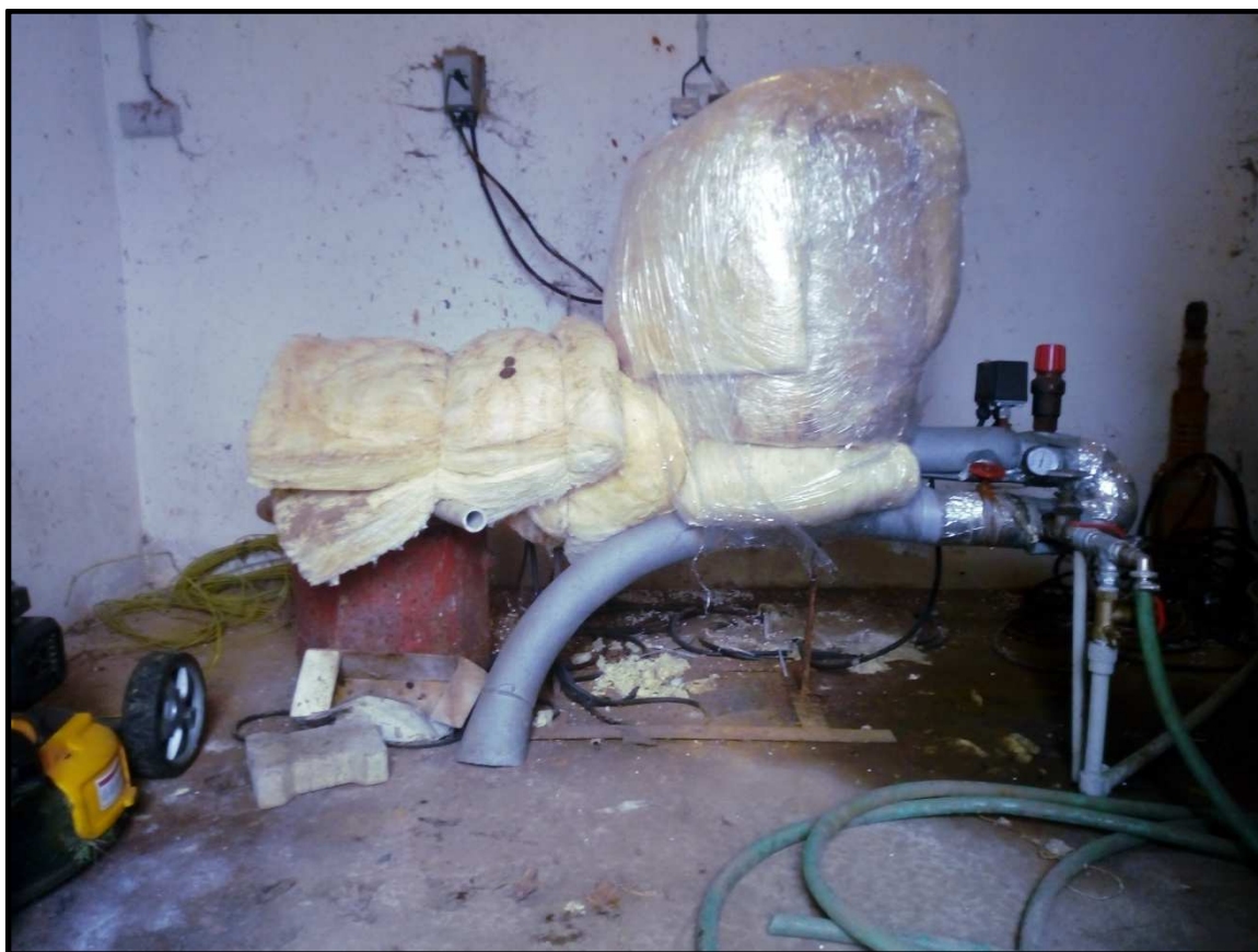
Studna SP-1 s instalovaným čerpacím zařízením.