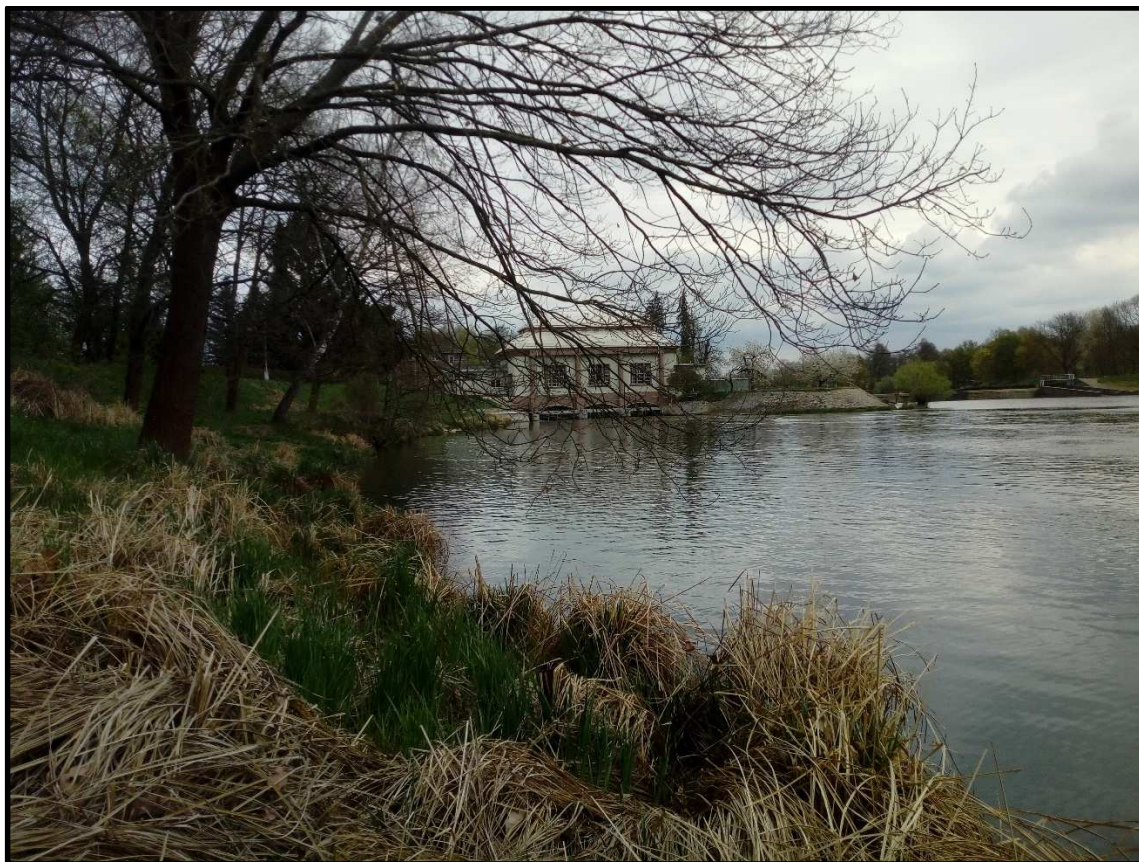
Tok Orlice u bývalé skládky (foto proti proudu toku), v pozadí Malšovický jez a MVE.